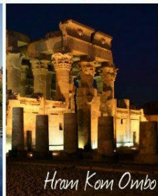
Hram Kom Ombo